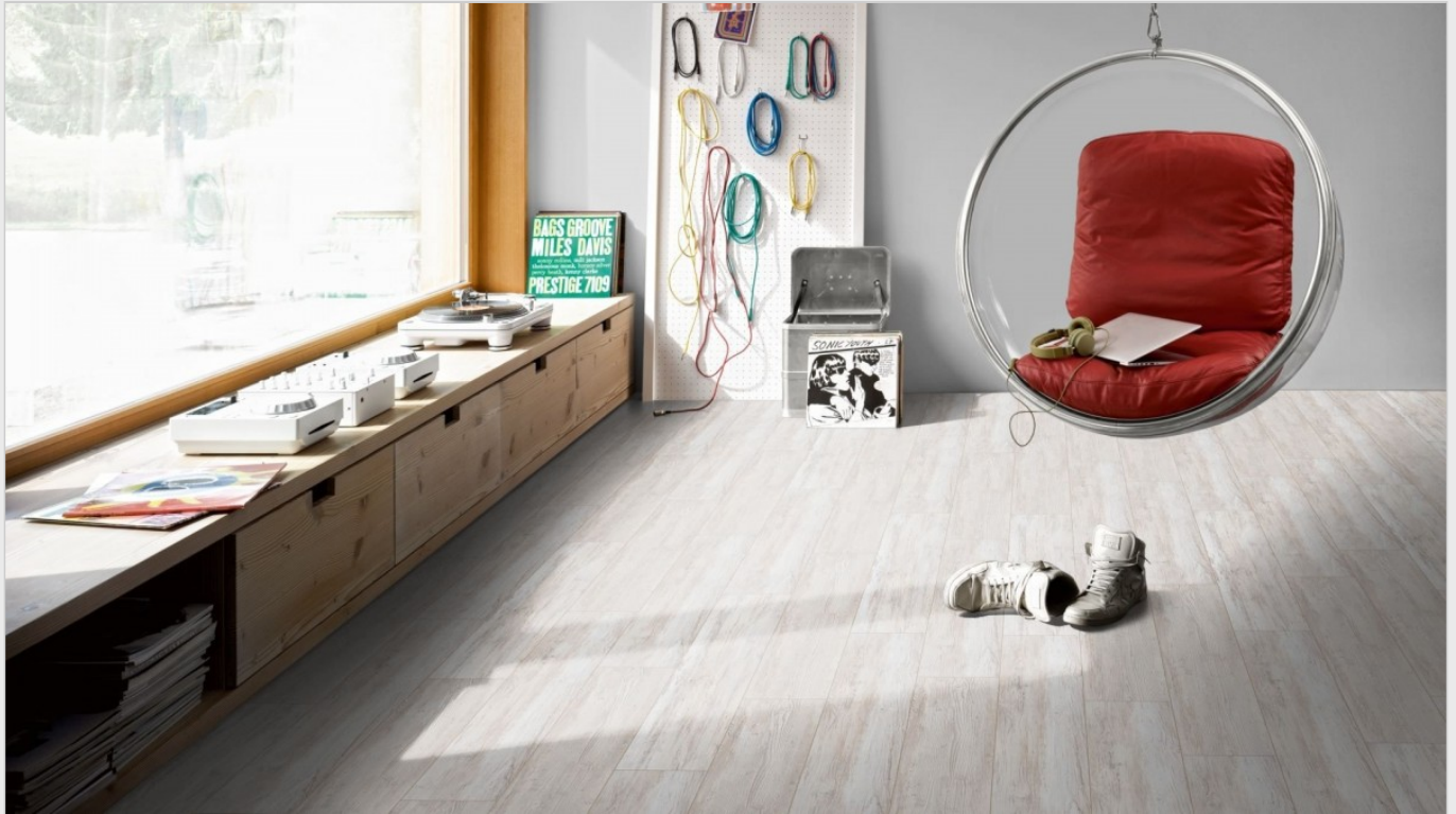
Parador Basic 5.3 Rigid Klick-Vinyl Pinie Skandinavisch Weiß SPC Designboden