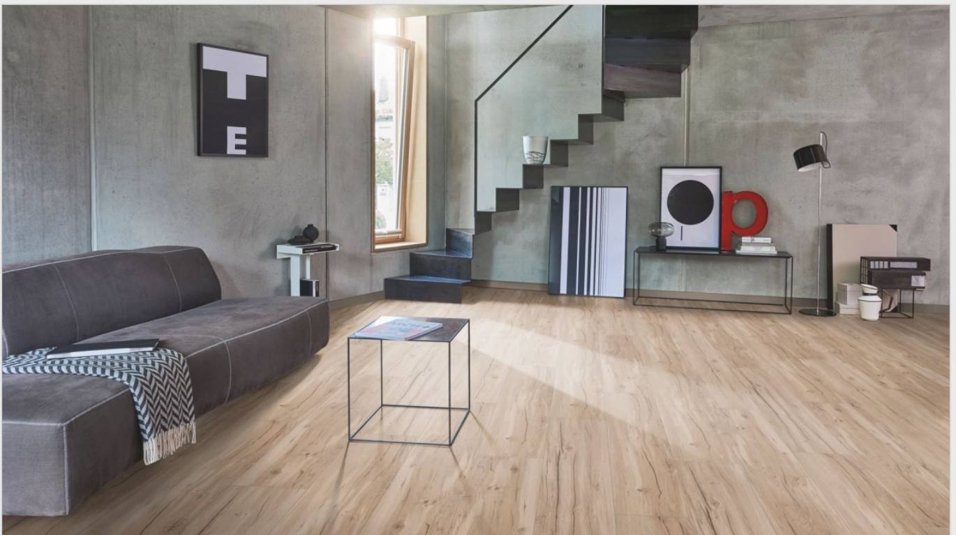
Parador Basic 5.3 Rigid Klick-Vinyl Eiche Memory Geschliffen SPC Designboden

Parador's Basic 5.3 Rigid Designboden auf SPC Trägerplatte mit Klicksystem und integrierter Trittschalldämmung ist ein Designboden der neusten Generation mit vielen Vorteilen.