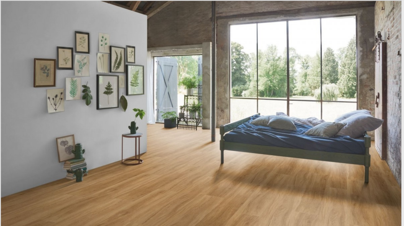
Parador Basic 5.3 Rigid Klick-Vinyl Eiche Sierra Natur SPC Designboden

Basis 5.3 ist ein Bodenbelag mit außergewöhnlichem Preis-Leistungs-Verhältnis von Parador.