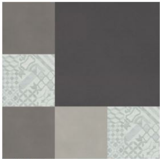
tile L / tile XXL / craft