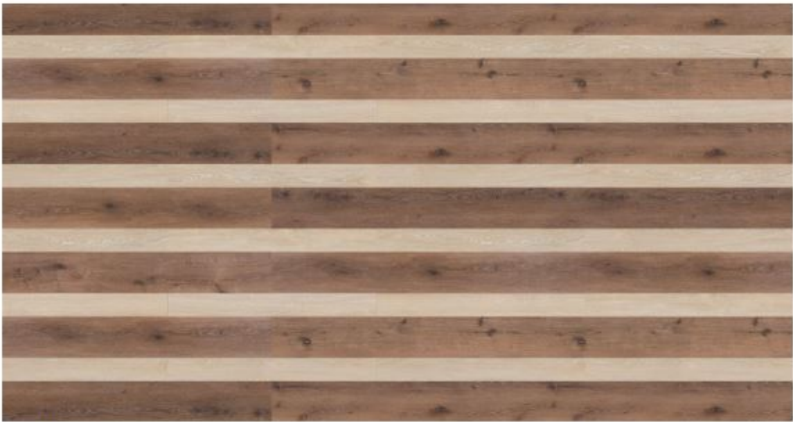
wood / craft