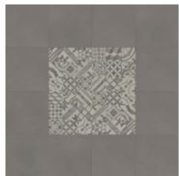
tile L / craft