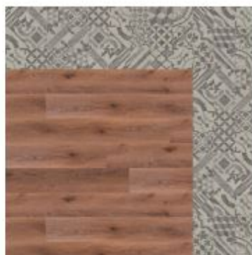
wood / craft