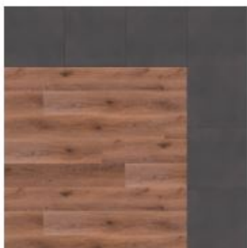
wood / tile