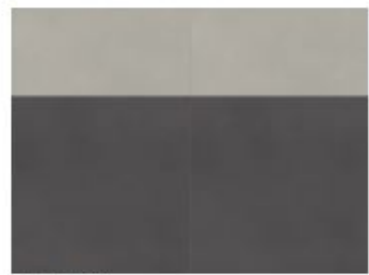
tile L / tile XXL